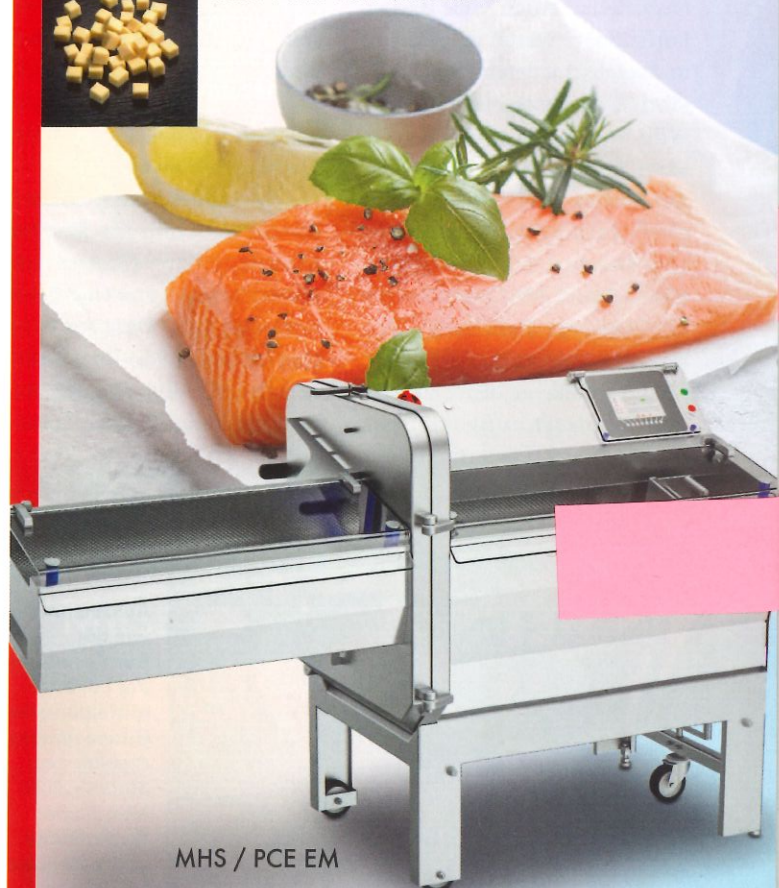
MHS / PCE EM

LASKA, der Partner für innovative Fleisch- und Lebensmittelverarbeiter.